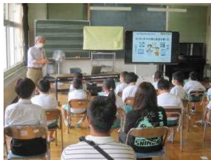
【情報モラル教室 3年生】