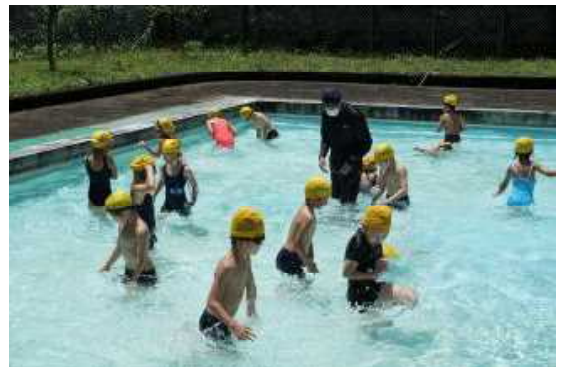
【初めてのプール 1年生】

コロナの影響で昨年は実施できませんでしたが、コロナの警戒度も下がり、楽しみにしていたプールの授業が始まりました。例年とは異なり、密を避け感染症対策を講じながら授業を行っております。子供たちは、約束をしっかり守ってプールに入っていてとても感心しています。何より楽しそうな笑顔がとても素敵です。プールについては、梅雨時期で天候や気温に左右され、急な中止や振替実施となる場合がございますので、毎日の検温やカードの押印などお忘れなく、ご協力をお願いします。