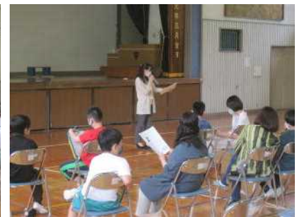
【親子エンカウンター 5年生】